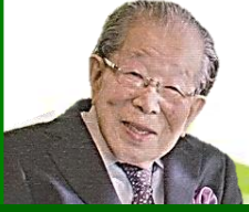
故 日野原重明先生