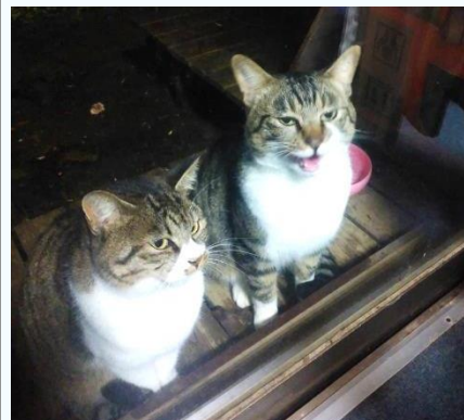
ひだりちゃんとだいちゃん

朝、カーテンを開けた瞬間「ニャー」と目を見て鳴かれると、なぜかメロメロになります。