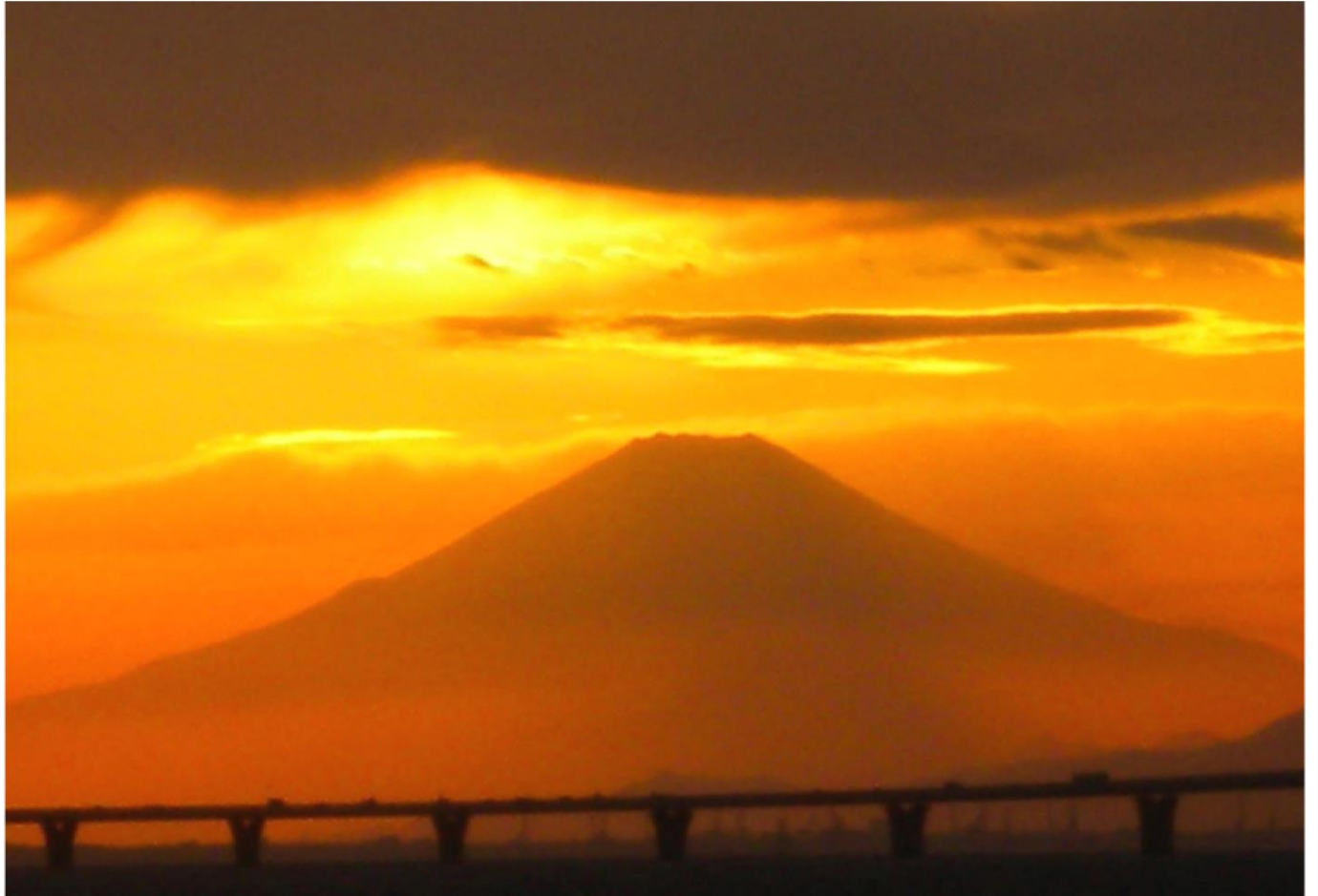
夕焼けの空に浮かぶ富士山 撮影地 袖ヶ浦海浜公園