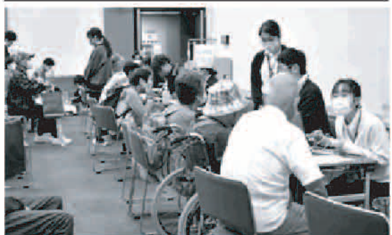
人気の健康相談・健康チェックコーナーは前日も大人気

「元氣100倶楽部」は、10月27日(日)福岡市東区の九州大 学病院内の医学部百年講堂で、5回目の「健康長寿フェア」を 開催します。今回も「高齢者活躍社会の実現をめざして」をテ ーマに、各種講演やパネルディスカッション、ブース出展、健康 チェックコーナーなど、多彩な内容となっています。多くの皆 さまのご参加をお待ちしております。