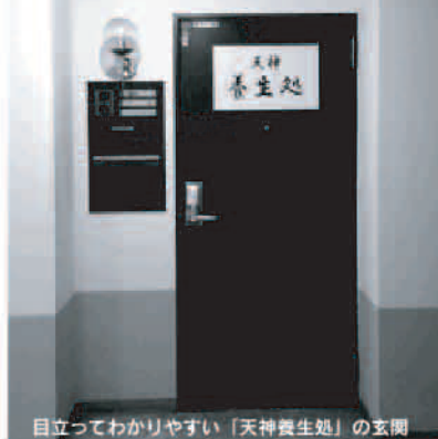
目立ってわかりやすい「天神養生処」の玄関