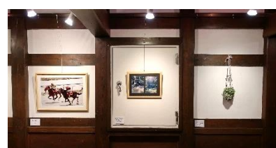
写真・松ぼっくりアート