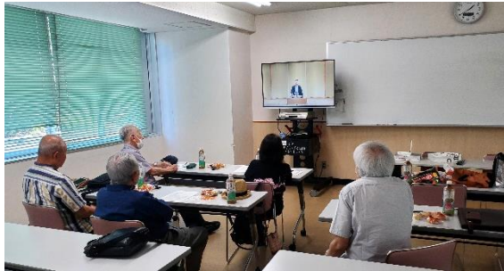
落語を鑑賞する参加者