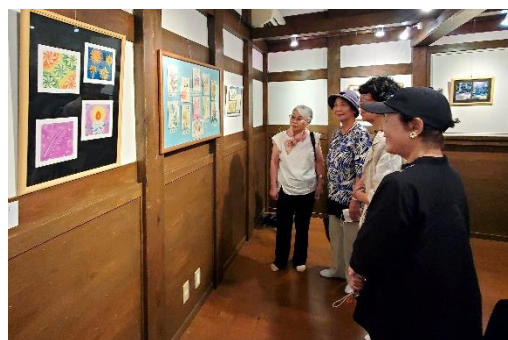
展示作品を鑑賞する来場者

会員の高齢化や減少が進む中、今回は昨年とほぼ同数の18名、56点の出展があり、来場者数は昨年を若干下回る110名となりました。