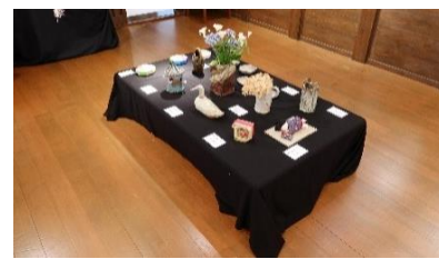
陶芸・木目込み・パンフラワー・折り紙