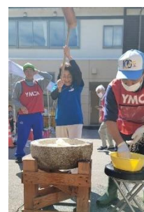
餅つきを行う筆者

そのような中を私は金沢から片道5時間かけて自家用車を運転して2日間通いましたが、県外からの他のメンバーは寝袋、餅つきの石臼や鍋、やかん、コンロなどの用具、食材、自分たちの4日間の食糧をすべて車につんで、とにかく現地では水だけ提供していただいて、1日4ウス、2日で8ウスのお餅をつき、避難しておられる方々に配りました。行列してお餅を受け取っていただいたお年寄りの御婦人方から、「今年初めてお餅を食べた、おいしかった」と喜んでいただき、疲れも吹っ飛び、生かされている喜びを実感しました。