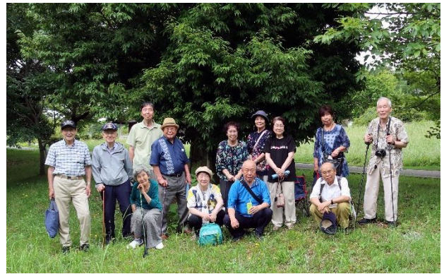
日野原重明先生百歳記念樹の下で記念撮影

参加者から、「大乘寺丘陵公園は初めて来たが、良い公園だ」、「桜の咲く頃やツツジの咲く頃にまた来たい」との意見があり、花見会を開催して良かったと思います。